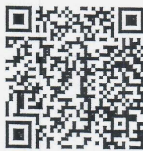
อินโฟกราฟิก