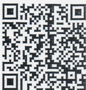
สล็อตประชาสัมพันธ์