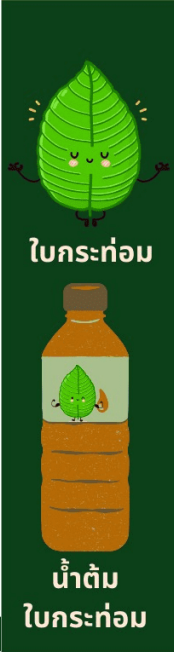
ใบกระท่อม