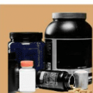
ผลิตภัณฑ์เสริมอาหาร (ของเหลวพร้อมดื่ม/เจล/เม็ด/แคปซูล)